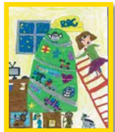
Izaro Sáñez (Donostia, 10 años)