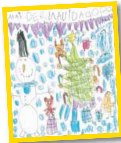
Maidar Garnil (Portugalete, 5 años)