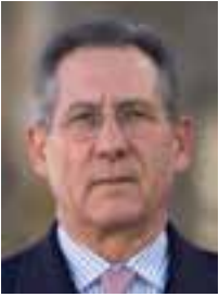
PEDRO MARTÍNEZ DE ARTOLA PRESIDENTE / LEHENDAKARIA