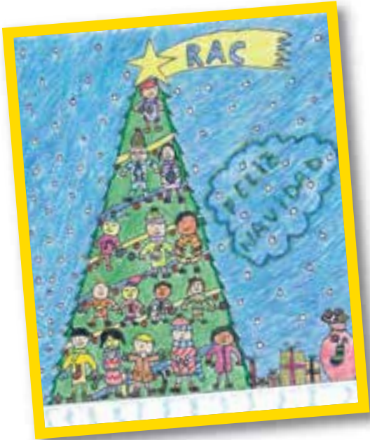
Aimar Garzón (Llodio, 12 años)

Según las edades, cambian las percepciones de la Navidad.